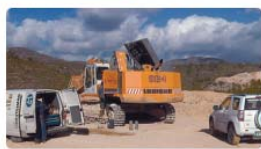
áridos y canteras