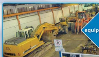
1.800 m2 de taller