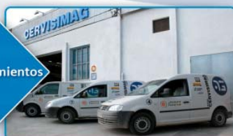
10 furgonetas taller