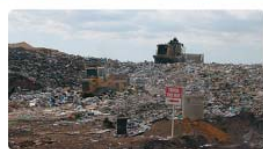
gestión de residuos